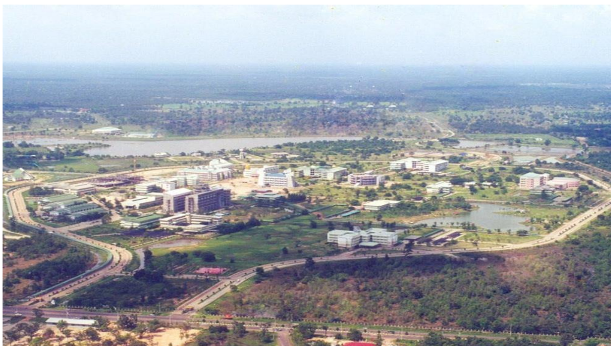
ภาพที่ ๙ แสดงพัฒนาการมหาวิทยาลัยในช่วงก่อตั้ง-ปัจจุบัน