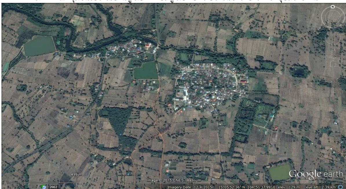
ภาพที่ ๓ ชุมชนโบราณบ้านคูเมือง ตำบลคูเมือง อำเภวารินชำราบ จังหวัดอุบลราชธานี