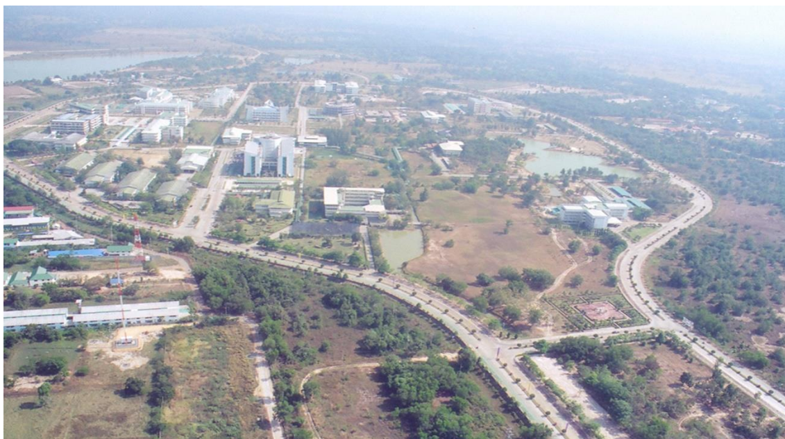
ภาพที่ ๘ แสดงพัฒนาการมหาวิทยาลัยในช่วงก่อตั้ง-ปัจจุบัน