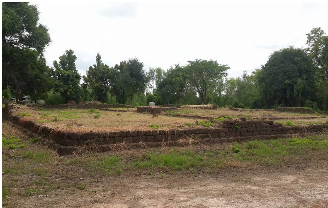
ภาพที่ ๕ แหล่งโบราณสถานบ้านโนนแก